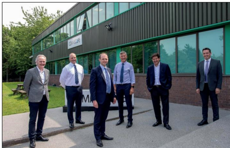
Ymwelodd Matt Warman AS, yr Is-ygrifennydd Gwladol Seneddol dros Seilwaith Digidol, â Commscope ym Modelwyddan i weld y cynnydd mewn cynhyrchu ceblau band eang fibr ar gyfer darparwyr rhwydwaith fel Openreach.

Mae'r gwaith yn Llanewy wedi canolbwyntio ar yr angen am fwy o amddiffynfeydd rhag lifogydd a gwaith ataliol yn sgil y stormydd yn gynnar y llynedd. Rydw i hefyd wedi gweithio