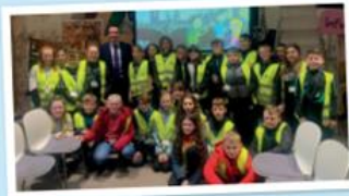
Pupils of Ysgol Esgob Morgan visiting Parliament

I was pleased to welcome pupils from Ysgol Esgob Morgan to the Parliamentary Education Centre in March 2020. I look forward to other schools visiting as soon as restrictions allow. If you are keen to visit Parliament, please get in touch with my office and we will do what we can to accommodate.