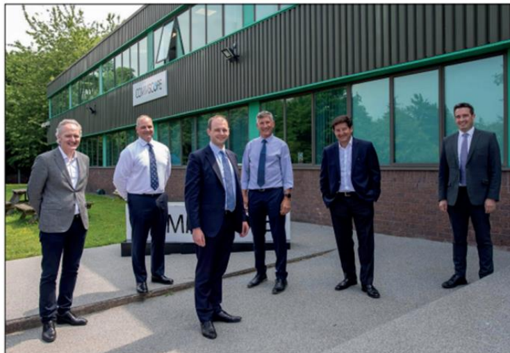
Matt Warman MP, Parliamentary Under-Secretary of State for Digital Infrastructure visited Commscope in Bodelwyddan to witness their expansion in the manufacture of fibre broadband cabling for network providers such as Openreach.

Rhuddlan Castle, St Asaph Cathedral and Denbigh Castle will soon, and very belatedly, benefit from brown signage