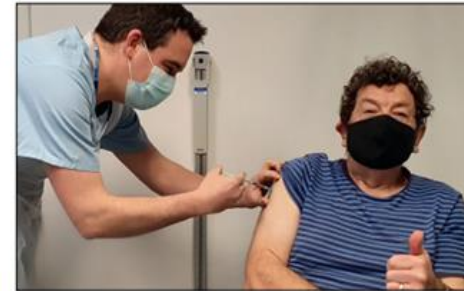
I have been proud to join colleagues vaccinating local people in the fight against Covid-19.

As a GP and member of the Commons Health & Social Care Select Committee, I have first-hand experience of how the healthcare system in North Wales is letting too many people down. My inbox is full of concerns from those who have suffered as a result. I am working with key individuals to see the