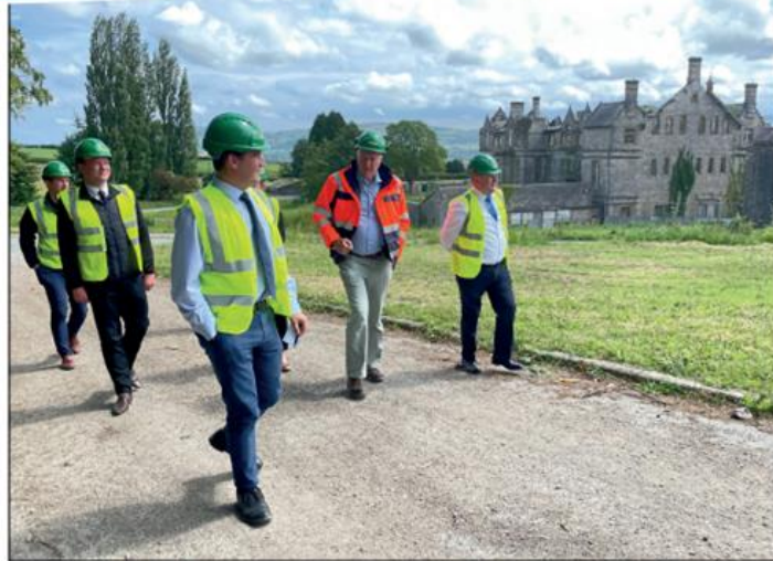
Jones Bros demonstrate their plans for the North Wales Hospital site in Denbigh, and their excellent apprenticeship programme.

Animal welfare issues are receiving increasing attention and I have been pleased to support legislation to ensure animal abusers face tougher sentences.