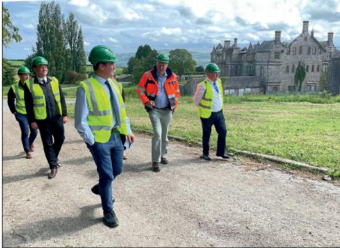
Jones Bros yn arddangos eu cynlluniau ar gyfer safle Ysbyty Gogledd Cymru yn Ninbych, a'u rhaglen brentisiaeth ragorol.

Mae diogelu ein hamgylchedd yn dal i fod yn uchel ar yr agenda cenedlaethol, ac rwy'n awyddus i adlewyrchu hynny'n lleol. Mae'r llysoedd yn yr ardal yn y blynyddoedd diwethaf wedi effeithio'n andwyol ar nifer o'r preswylwyr ac rwy'n parhau i weithio i sicrhau ein bod yn cael ein hamddiffyn yn well yn y dyfodol. Rydw i hefyd yn gwneud fy ngorau i atal datblygiadau tai newydd ar dir sy'n dueddol i lifogydd. Yn ddiweddar, trefnais Uwchgynhadledd Hinsawdd yn Nyffryn Clwyd, lle bu tri pannel o arbenigwyr yn ymgysylltu'n adeiladol â phreswylwyr i ystyried sut gallwn bob un ymddwyn mewn ffordd ecoffeiilgar. Trafodwyd cylleoedd ynni gwyrdd yn ein rhanbarth hefyd - o ynni'r llanw i gynhyrchu hydrogen, a chipio a storio carbon. Yn Senedd y DU, rwy'n gweithio ar gnygion i ymddrin â llygredd aer a sbwrll ac i gyflwyno cynllun dychwelyd ernes newydd. Mae materion lles anifeiliaid yn cael mwy o sylw bellach ac rwy'n falch o gefnogi deuddfwrtaeth i sicrhau bod y rhai hynny sy'n cam-drin anifeiliaid yn wynebu deddfyadau llymch.