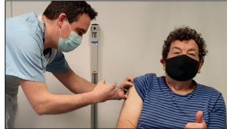
Rydw i wedi bod yn falch o gael ymuno â chydweithwyr i frechu pobl leol yn y frwydr yn erbyn Covid-19.

Fel meddy teulu ac aelod o Bwyllgor Dethol Iechyd a Gofal Cymdeithasol Tŷ'r Cyffredin, mae gen i brofiad uniongyrchol o sut mae'r system gofal iechyd yng Ngogledd Cymru yn siomi gormod o bobl. Mae fy mewnfwch